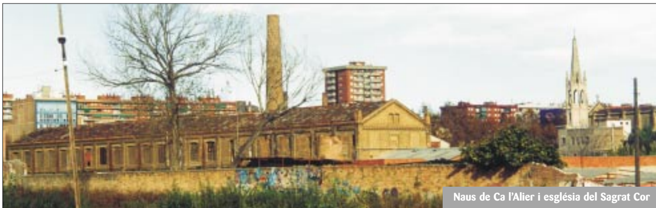
Naus de Ca l'Alíer i església del Sagrat Cor

Les autoritats municipals duen a terme, amb la participació dels ciutadans i ciutadanes, una planificació i una gestió urbanes que assoleixin l'equilibri entre l'urbanisme i el medi ambient.