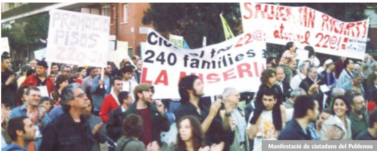
Manifestació de ciutadans del Poblenou

trencament poden ser imprevisibles. És responsabilitat de tots vetllar perquè això no passi; sobretot, perquè la llibertat i la seguretat són valors democràtics irrenunciables. Però també cal tenir en compte que el fenomen dels menors desemparats és molt complex i les lleis actuals donen les competències i responsabilitats a la Generalitat, que en té la tutela. Aquesta tasca, però, s'ha de fer amb condicions i recursos suficients. Els veïns han assumit i assumeixen el fet de tenir un centre de menors al costat, però també demanen que si es genera conflictivitat al carrer aquesta sigui eradicada. És lamentable que els menors vinguts d'altres països, però també podríem dir-ho dels d'aquí, es facin malbé amb la droga i la violència gratuïta. Cal que les administracions donin prioritat a aquesta problemàtica i desenvolupin les tasques pedagògiques i educatives per fer-hi front.