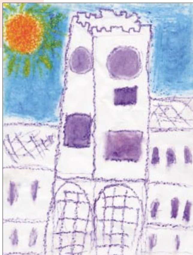
Dibuix de Can Ricart (jornada de portes obertes, 11 de juny de 2005)

A més, el deteriorament físic d'algunes naus de Can Ricart no és motiu suficient per a la demolició, si el conjunt conté valors que el converteixen en un document excepcional que explica per edat, autoría, mida i funció, la plasmació urbanística dels inicis de la primera revolució industrial a Barcelona. En un moment, a mitjan del segle XIX, en què Ildefons Cerdà inventava la ciutat moderna i a Sant Martí de Provençals s'hi instal·lava de manera incipient el que acabaria sent la major concentració industrial de la península i el motor de l'economia catalana, uns industrials de Casserres, els Ricart, instal·laren al Poblenou una de les més importants fàbriques tèxtils del país. Un entramat de naus, places i carrers amb una organicitat i una qualitat