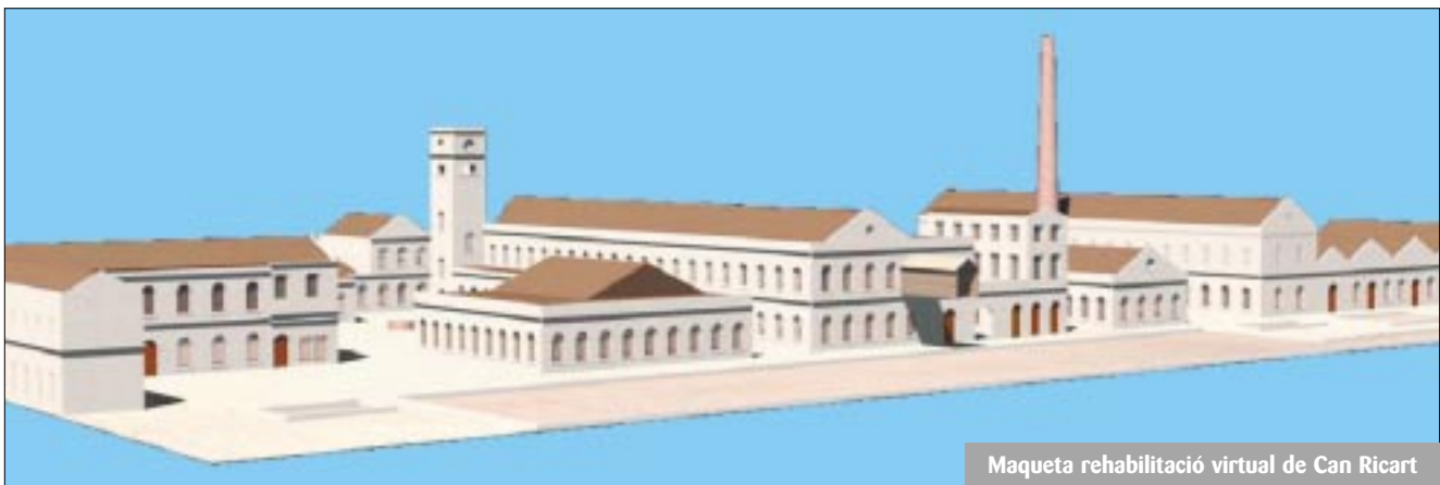
Maqueta rehabilitació virtual de Can Ricart

La circumstància i alhora el contrasentit que empeny ara les empreses del Poblenou cap a fora de la ciutat és la gestió municipal, que deixa que el cost de la radicació sigui el principal determini de quines empreses poden existir al 22@ i quines no. A la pràctica, ho hem pogut veure a Can Ricart, on la mediació de l'Ajuntament, representat per JC