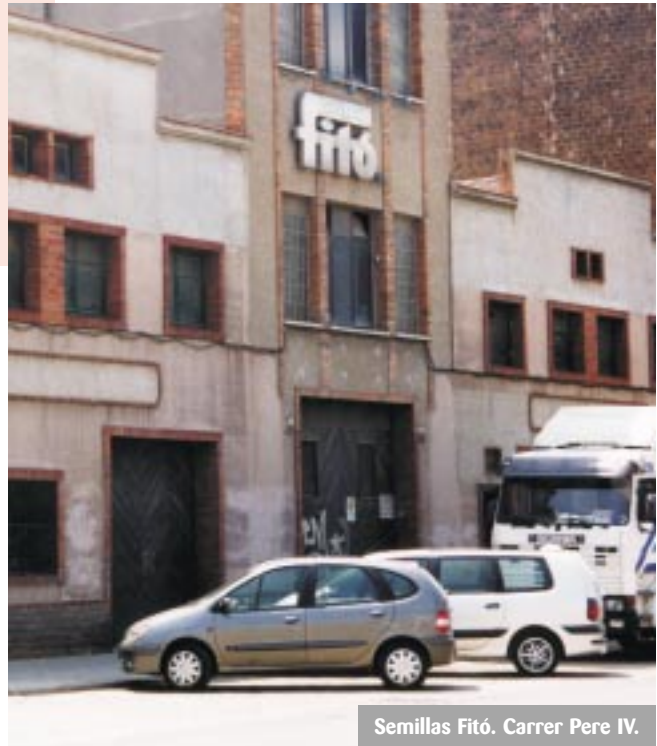
Semillas Fitó. Carrer Pere IV.

Cap d'aquests plans afecta directament la plaça, només preveuen obrir el carrer just fins arribar per l'esquerra a la placeta, a la que serà la cruïlla amb el carrer Provençals i, per la dreta, fins a Selva de Mar. Les obres per urbanitzar el tram del carrer Marroc entre Fluvià i Bac de Roda s'estan fent aquests dies. Tot indica que tard o d'hora la placeta pot acabar desapareixent. Per tant, és ara que hem de fer veure a l'Ajuntament que cal trobar alternatives al traçat del carrer Marroc. Una possibilitat apuntada fa ja més d'un any entre responsables de 22@bcn i membres de l'AVPN i del FRB consistiria a desviar el carrer Marroc just per evitar la plaça, en el punt en què convergeix amb Pere IV. També hi ha la possibilitat de donar prioritat al carrer Perú com alternativa al trànsit que travessarà el barri transversalment, per no haver d'obrir la traça de Marroc pel damunt de la plaça del Sagrat Cor. Hi ha solucions doncs, Tot és qüestió de voluntat.