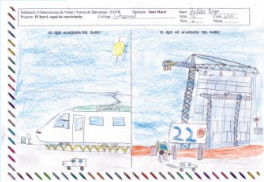
Dibuix realitzat per un nen veí del Poblenou en el programa "El barri, espai de convivència" de la FAVB.

Ja fa algun temps que l'Ajuntament de Barcelona va encarregar un estudi per a una nova distribució territorial que afecta els barris de la ciutat. El que es proposa és reestructurar la delimitació dels barris perquè aquests no superin els 25.000 habitants, i considerar-los unitats funcionals per a la seva dotació d'equipaments i serveis. El nou criteri pot xocar amb la identitat social i històrica de les barriades de la ciutat. És el cas del Poblenou, que quedaria dividit en cinc parts, segons la proposta feta per l'equip de l'alcalde Clos. Però qüestionar els barris actuals, que tenen una singularitat cultural des d'on s'articula la convivència i el dia a dia, té el risc d'afectar també el teixit associatiu de la ciutat i acabar condicionant la vida de barri a criteris estrictament administratius sense cohesió ni vida pròpia.