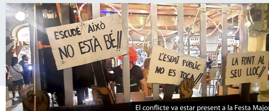
El conflicte va estar present a la Festa Major