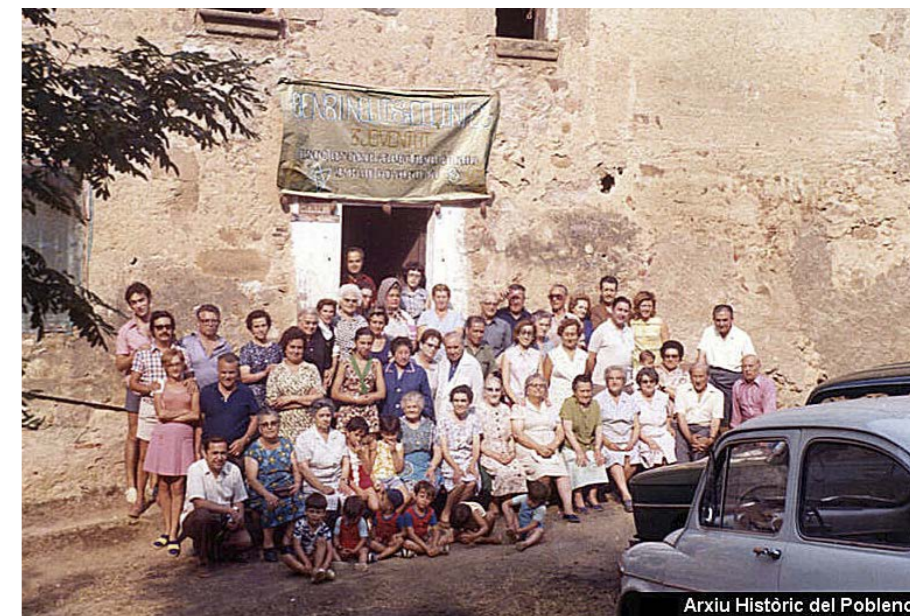
Arxiu Històric del Poblenou

Per l'octubre i el novembre està previst presentar una exposició sobre la seva figura i obra al Casal de Barri de la Rambla i a la seu de l'Arxiu Històric del Poblenou, a la Torre de les Aigües. Allà